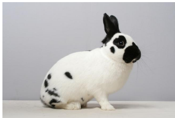
Lotharingerdwerg zwart, definitief erkend. Fokker: H. Philipse

Per 1 april 2012 zijn voorlopig erkend voor een periode van 2 jaar(t/m 31 maart 2014):