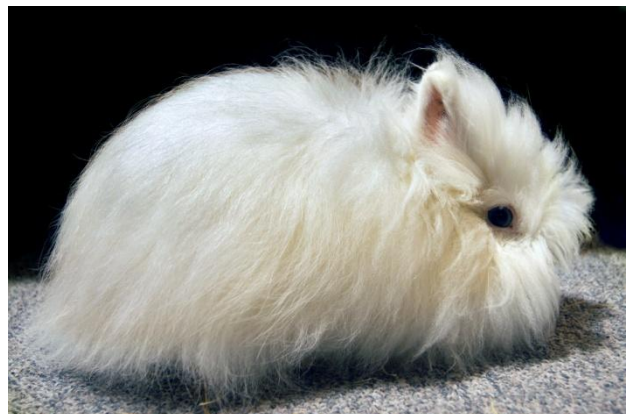
Teddydwerg wit blauwoog man en vrouw jong, voorlopig erkend. Fokker: S. Visser

Puntenschaal Groep 7. Bijzondere Haarstructuur